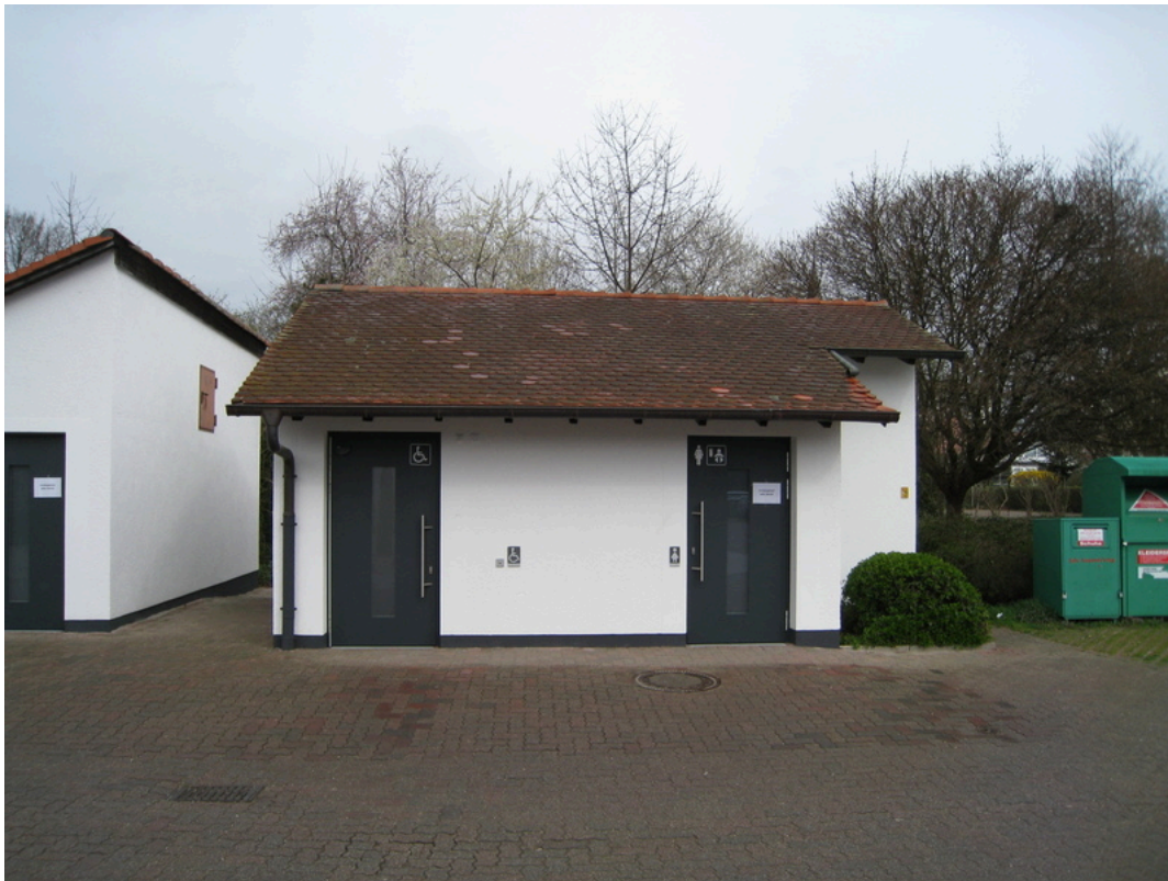
Barrierefreie Toilettenanlage am Festplatz Herxheim